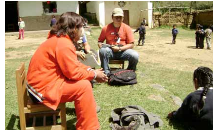
Distrito de Pataz. Visita con ONG Ciudad Saludable y Asociación Pataz a la institución educativa de Los Alisos.

Se han invertido 11,220.00 nuevos soles en estos estudios con fondos donados por Compañía Minera Poderosa.