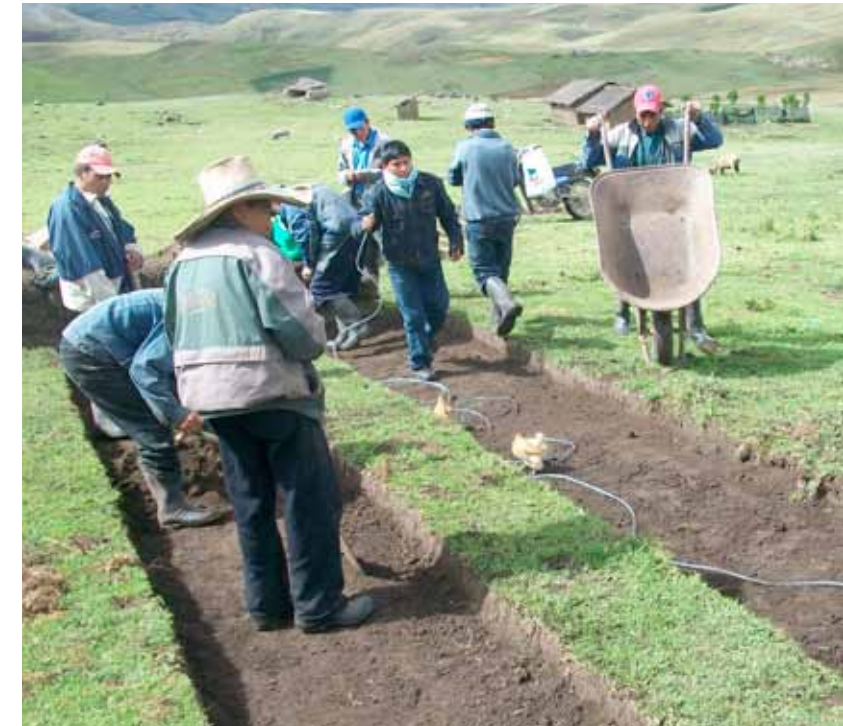
Macullida (distrito de Chugay). Preparación de camas de almácigo y repique.

Se ejecutó un financiamiento de 23,292.00 nuevos soles con fondos donados por Compañía Minera Poderosa S.A.