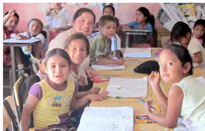
Distrito de Pataz. Acompañamiento a sesión de niños y niñas de primer y segundo grado de la institución educativa Chagual.