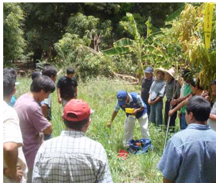
Chagualito (distrito de Pataz). Personal técnico brindando una capacitación en técnicas de monitoreo.

Se ejecutó un financiamiento de 48,503.00 nuevos soles con fondos donados por Compañía Minera Poderosa S.A.