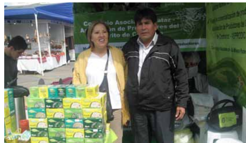
Lima. Santa Natura interesada en los productos ALLY QAMPY.

Asociación Pataz, en alianza con la Asociación de Productores del Distrito de Cochorco-ASPRODIC y el Programa de Desarrollo Productivo Agrario Rural - AgroRural de la Dirección Zonal La Libertad, ha continuado fortaleciendo las capacidades de sus asociados en el procesamiento y comercialización de productos; principalmente hierbas aromáticas en filtrantes (infusión) de hierbaluisa, manzanilla, panizara y menta bajo la marca ALLY QAMPY (en quechua significa planta que cura).