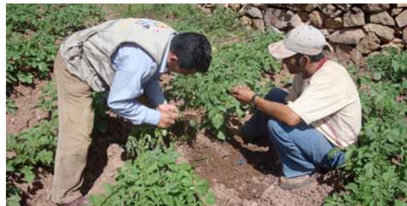
Pamparacra (distrito de Pías). Evaluación de plagas y enfermedades en cultivo de papa.

154,585.00 nuevos soles donados por Poderosa fueron invertidos en este proyecto.