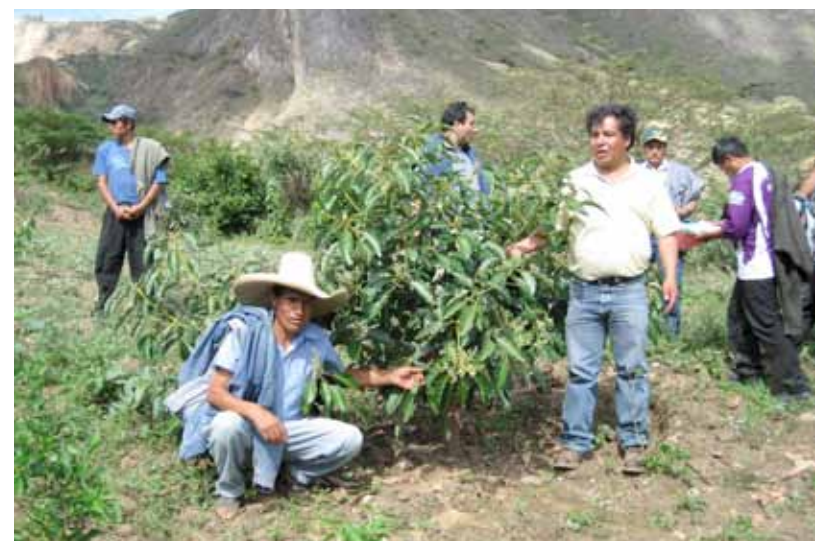
Distrito de Sartimbamba. Visita de campo para realizar evaluaciones de plagas y enfermedades en plantaciones de palto.

Para ello, los productores se han organizado para recibir apoyo en asistencia técnica con el fin de mejorar su producción de palto y facilitar el acopio, lo que ha generado una oferta de calidad para el mercado.