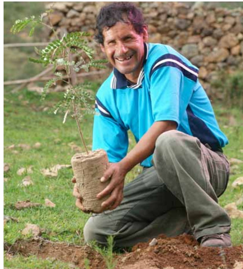
Macania, Chuquitambo (distrito de Pataz). Se evalúa prendimiento de la tara.

El proyecto fue financiado con 36,740.00 nuevos soles otorgados en calidad de préstamo por Compañía Minera Poderosa S.A. a través de Asociación Pataz, 17,500 nuevos soles donados por la Municipalidad Distrital de Pataz y la comunidad aportó con mano de obra y terrenos.