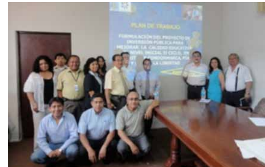
Trujillo. Reunión del equipo técnico de formulación del proyecto de inversión pública de mejoramiento de la educación inicial en Pataz, Pías y Condormarca.

14,489.00 nuevos soles se han invertido para la ejecución de esta actividad en el 2010 gracias a las donaciones de Compañía Minera Poderosa S.A.