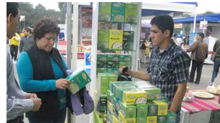
Lima. ASPRODIC presente con sus productos ALLY QAMPY.