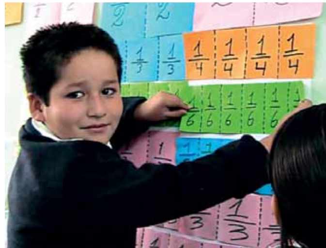
Distrito de Pataz. Sesión demostrativa en el área de matemática con niños y niñas.

Esta actividad es ejecutada con el financiamiento de Compañía Minera Poderosa S.A. mediante un convenio suscrito con la Unidad de Gestión Educativa Local –UGEL de la provincia de Pataz–, con el fin de garantizar la contratación de docentes en diferentes instituciones educativas para mejorar la cobertura educativa y fortalecer el servicio de la enseñanza básica regular en centros educativos de Vijus, Shicun, Socorro, Vista Florida, Nimpana, Los Alisos, Suyubamba y Tayabamba.