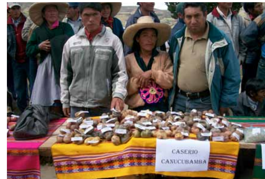
Distrito de Chugay. Feria de papas nativas, muestras seleccionadas.