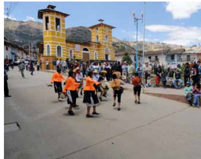
Distrito de Cachicadán. Inauguración de evento central en la plaza de armas.