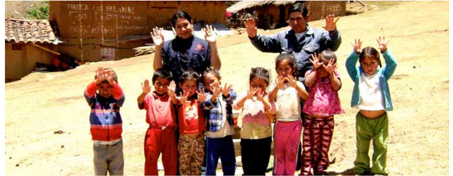
Distrito de Pataz. Desarrollo de la estrategia de lavado de manos con niños del PRONEI de Shicun.

> Se ha disminuido la prevalencia de la desnutrición crónica de 25% a 20.18% durante los tres años de ejecución del proyecto, respecto al estudio de línea base.