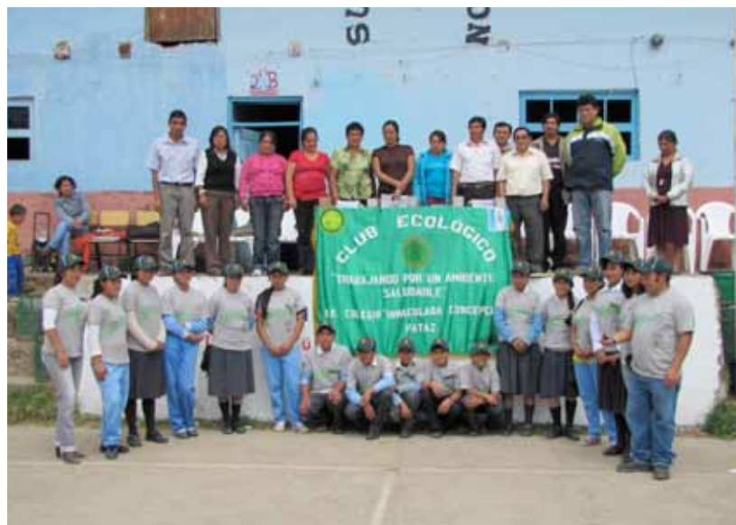
Distrito de Pataz. Club ecológico IE Inmaculada Concepción de Pataz.

Se ejecutó un financiamiento de 15,088.00 nuevos soles con fondos donados por Compañía Minera Poderosa S.A.