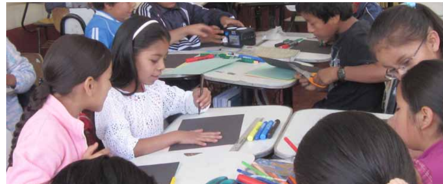
Distrito de Pataz. Niños y niñas de Campamento desarrollando actividades en sesión demostrativa del área de comunicación.