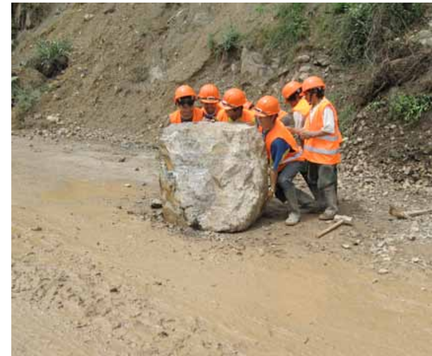
Distrito de Cochorco. Limpieza de huaico y lodo.

En el periodo de enero a abril del 2010 se gastaron S/.232,794.00 del Fondo Minero Regional.