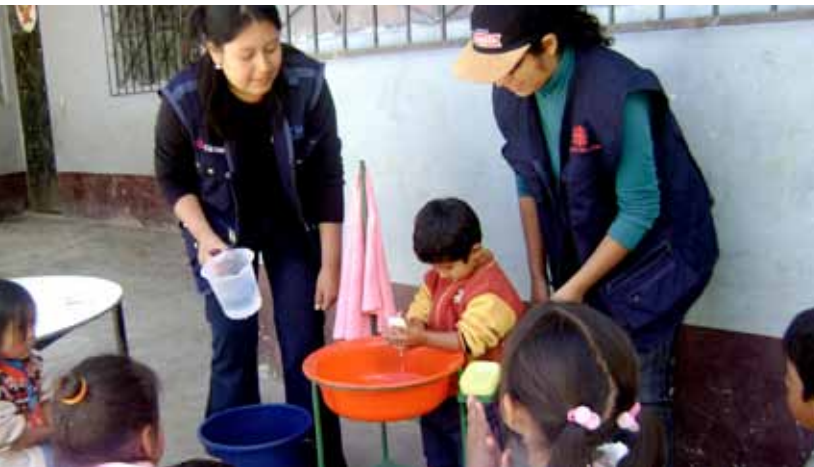
Distrito de Pataz. Sesión demostrativa de lavado de manos con niños del nivel primario en Socorro.

El ámbito de intervención es de 14 poblaciones del distrito de Pataz (Campamento, San Fernando, Los Alisos, Vista Florida, Zarumilla,