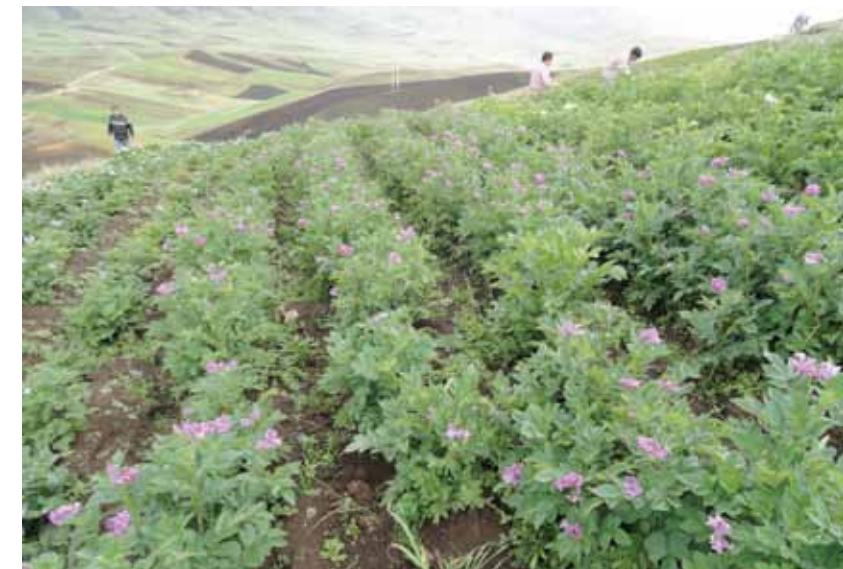
Canucubamba (distrito de Chugay). Evaluación de floración de parcela de caracterización.