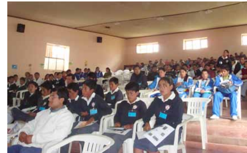
Distrito de Tayabamba. Encuentro preparatorio.