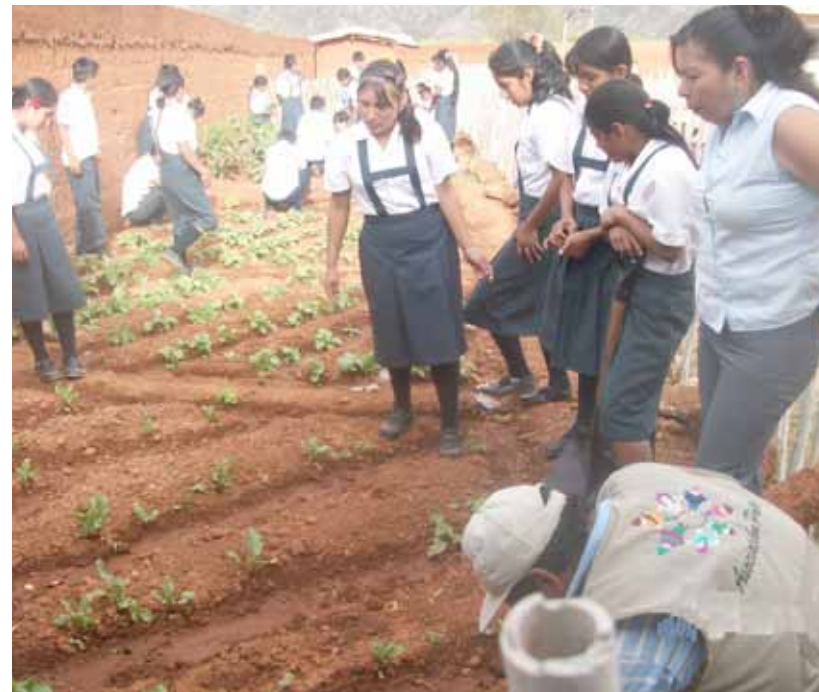
Nimpana (distrito de Pataz). Deshierbo de hortalizas.

Se ejecutó un financiamiento de 1,179.00 nuevos soles con fondos donados por Compañía Minera Poderosa S.A.