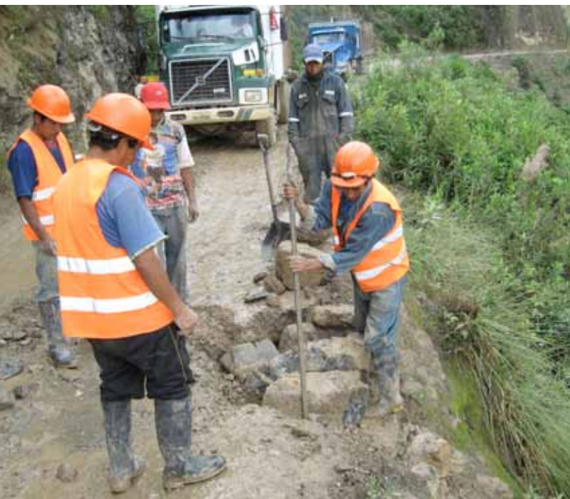
Distrito de Cochorco. Recuperación de plataforma de carretera con pircas.

Dentro del proyecto Mantenimiento de la Carretera Puente Pallar – Puente Comaru, en sus tramos I, II y IV que se ha venido ejecutando en convenio con el Gobierno Regional de La Libertad, se ha realizado el mantenimiento comunal de cunetas del primer tramo de esta carretera entre enero y abril del 2010. Esto con fondos del aporte voluntario regional de las empresas del Grupo Minero Regional La Libertad.