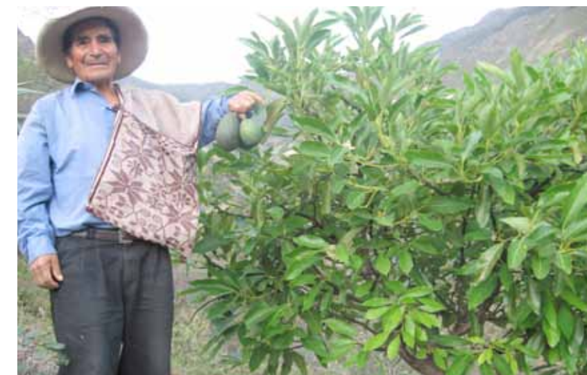
Naranjo (distrito de Cochorco). Productor mostrando su producción de palta.