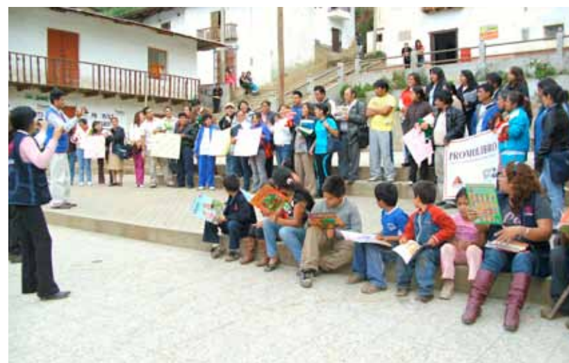
Distrito de Pataz. Caminata por la lectura para la promoción del Programa Promolibro con docentes de la Red Educativa Pataz.

La inversión en este proyecto fue 379,736.00 nuevos soles donados por Compañía Minera Poderosa S.A. y 497,398.00 nuevos soles donados por Cáritas Española.