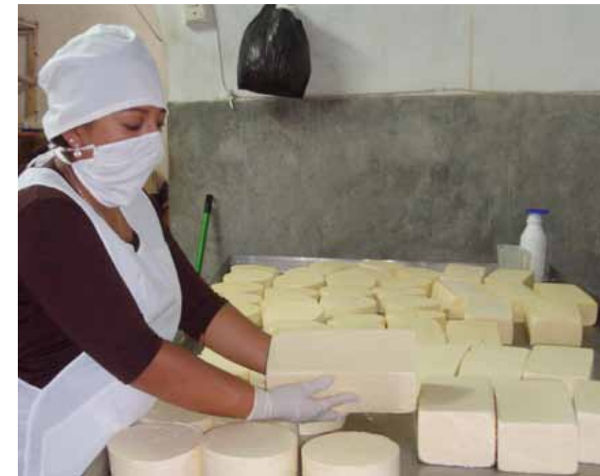
Distrito de Chilia. Presentación de queso terminado.

Se ejecutó un financiamiento de 14,813.00 nuevos soles con fondos donados por Compañía Minera Poderosa S.A.